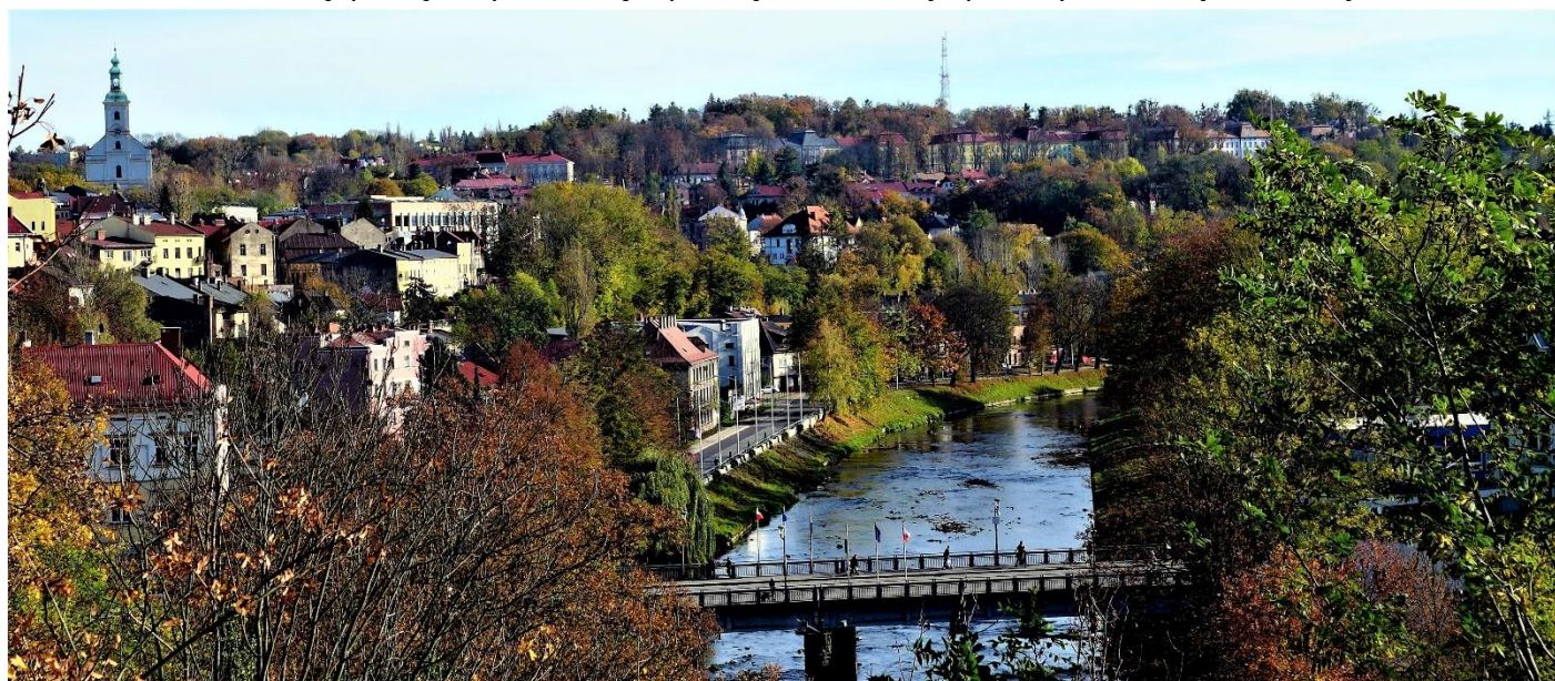
Widok na „Most Przyjaźni”, nad Olzą, ze Wzgórza Zamkowego.

Cieszyn jest wyjątkowo interesującym miastem polsko- czeskiego pogranicza. Olza oddziela urokliwą, pełną zabytków część polską, od bardziej uprzemysłowionej – czeskiej.